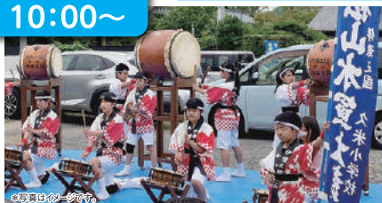
久米小学校 水軍太鼓クラブ